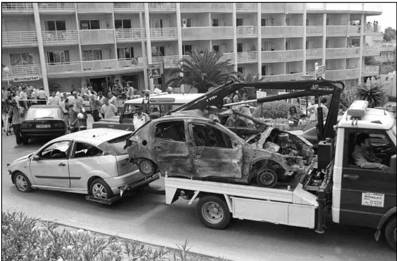
انفجار في اسبانيا. رافعة تسحب سيارتين متضررتين من الانفجار الذي وقع يوم السبت الماضي في الشمال الشرقي من اسبانيا

وقال البيان ان التشكيل الوزاري الجديد لخاتمي والذي لا يشمل حتى امرأة واحدة ورغم عودته الانتخابية اثار سلسلة جديدة من الخلافات بين الأجنحة المتخاصمة حيث وتركبة مجلس الوزراء والصراعات حوله مؤشرا لتفاقم نوعي لا رجعة فيه للصراع على السلطة.